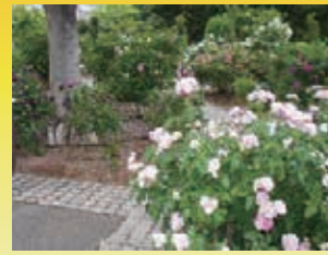
バラの原種のサンショウバラやハマナシなどが植栽されています。