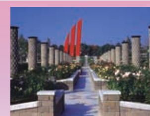
正面ゲートを抜ければ1万本のバラが迎えてくれます。