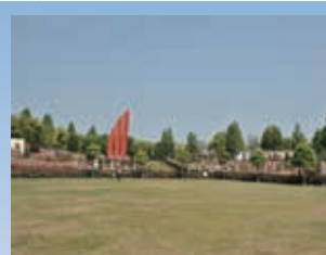
周囲をバラに囲まれたこの広場は約4,000㎡あり、開放感いっぱいです。