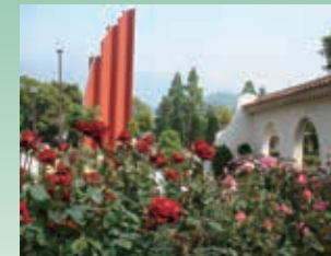
白壁とヘデラに囲まれて、日本で作出されたバラを集めたコーナーです。