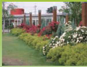
荒牧バラ公園やみどりに関係する展示を行っています。休憩所としてもご利用できます。

地元の造園業者さんや市民ボランティアの皆さんの協力でモデル庭園を展示しています。