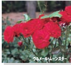
ウルメール・ムーンスター

赤：ウルメール・ムーンスター、アンクルウォルター ピンク：レインボー・リバー、エマニエル、アンジェラ オレンジ：ふれ太鼓、サラバンド、チャールストン ページュ：パタースコッチ 黄：エバゴールド