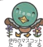
伊丹のマスコット だみまる

ホームページ http://hccweb1.bai.ne.jp/midoriplaza/ (バラの開花状況が確認できます。)