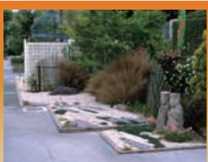
地元の造園業者さんの作品です。庭造りの参考にしては……。