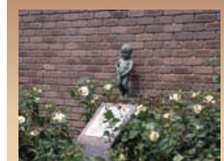
可愛い小便小僧を中心にベルギーで作出したバラが見られるコーナーです。