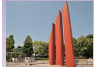
市民の寄付金で建築された三本の柱『平和モニュメント』からは公園全体が見渡せます。