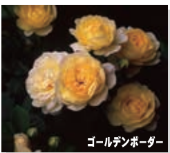
ゴールデンボーダー