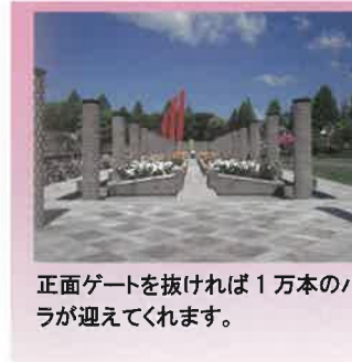
正面ゲートを抜ければ1万本のバラが迎えてくれます。