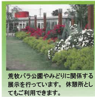
荒牧バラ公園やみどりに関係する展示を行っています。休憩所としてもご利用できます。