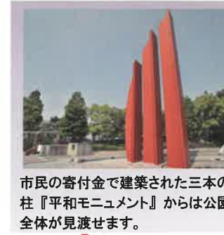
市民の寄付金で建築された三本の柱『平和モニュメント』からは公園全体が見渡せます。