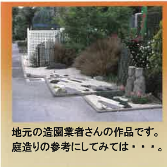
地元の造園業者さんの作品です。庭造りの参考にしてみてもいいです。