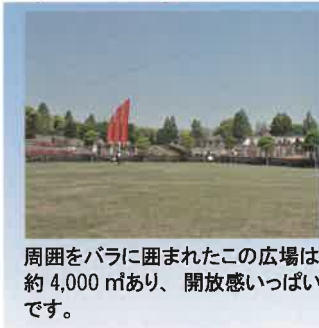
周囲をバラに囲まれたこの広場は約4,000㎡あり、開放感いっぱいあります。