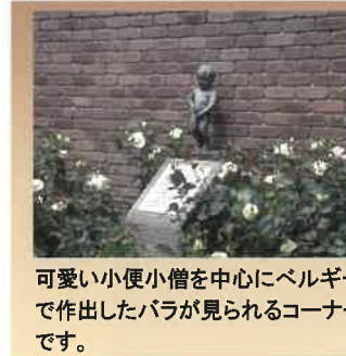
可愛い小便小僧を中心にベルギーで作出したバラが見られるコーナーです。