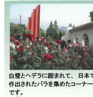
白壁とヘデラに囲まれて、日本で作出されたバラを集めたコーナーです。