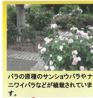
バラの原種のサンショウバラやナニワイバラなどが植栽されています。