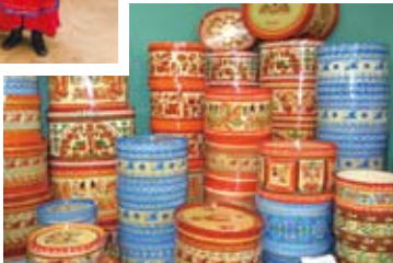
ロシア北西部 アルハンゲリ斯克州の 民芸品▶

広大な国土を持ち、さまざまな民族や宗教、思想が共存するロシアでは、民芸品も地方によって風合いや意味合いが異なり、その豊かな色彩が人々の生活に安らぎを与えてきました。有名なマトリョーシカ以外にも、人を幸せにする知られざる民芸品がたくさんあります。歴史や習慣、食、文化なども交えながら、民芸品から広がるロシアの魅力をお伝えします。