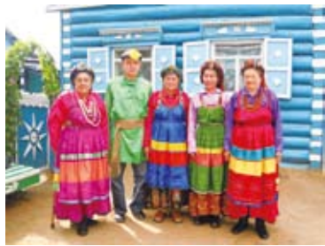
◀シベリア (バイカル湖東部) ブリヤート共和国の 民族衣装